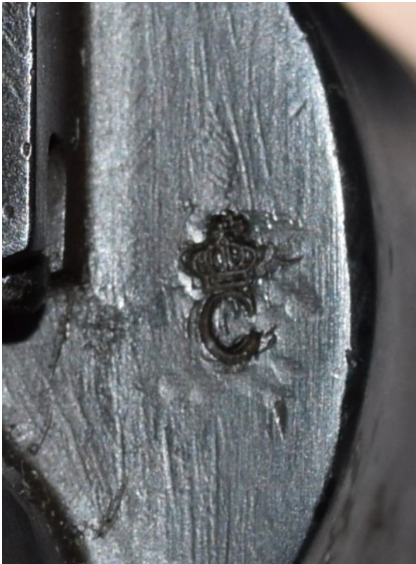
Märkning på dämparen: Carl Gustaf stads Gevärsfaktori