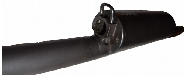
Mynning på "dämparen"