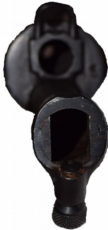
Bajonettens fäste på gevär m/1896